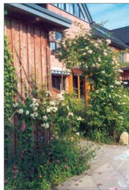
Foto: Die Komposterde liefert wertvolle Nährstoffe für das Rosenbeet